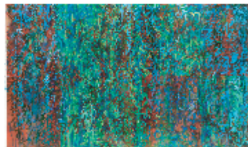
储楚 璀璨的星 立春