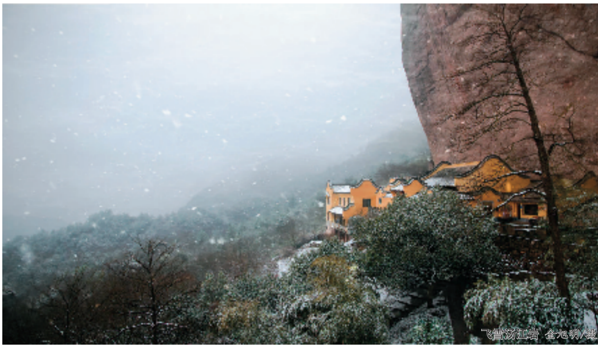
飞檐汤江岩

春天，白塔湖遍地铺金，满畈满坳的油菜花开了，可乘着一叶扁舟，沿着弯弯的河道，一探白塔湖的明媚春色；盛夏，正是荷叶翠绿的季节，在白塔湖绿粼粼的水面上，一片片荷叶清丽如盖，影映于清波涟漪中，一眼望不到边；深秋，晚霞照射在白塔湖上，木芙蓉花朵凌霜绽放，堪与菊英