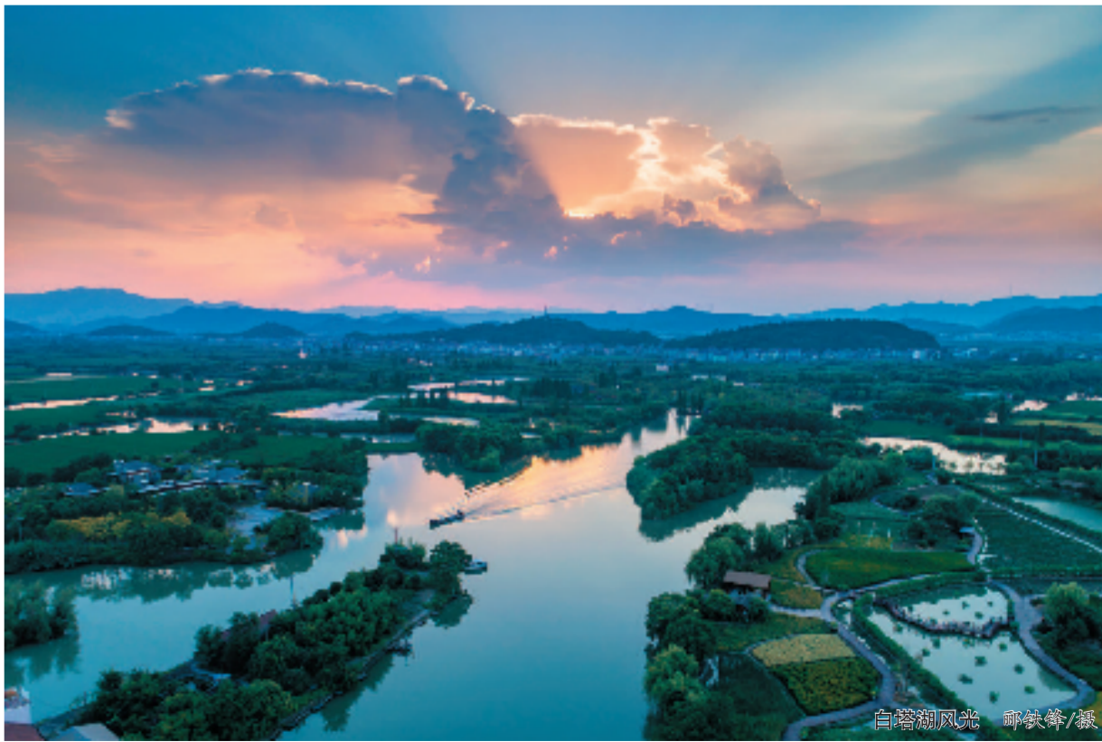
白塔湖风光

葱郁繁茂的植被，清澈的湖水，雄壮的瀑布，古老的禅寺……在这个走进水系巨著《水经注》的地方，你可以寻找很多构建画面的元素。此外，不可错过马剑古镇的秦皇古道和当地特色美食“马剑八大碗”，更可去茆艺小镇了解“茆文化”的渊源历史与独特魅力。