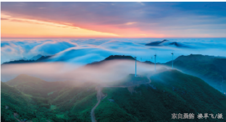
索自晨韵 凌军飞/摄

此外，历史悠久的千柱屋、风景秀丽的春风十里小镇及历史文化底蕴深厚的枫桥古镇亦如璀璨明珠，都值得一探究竟。