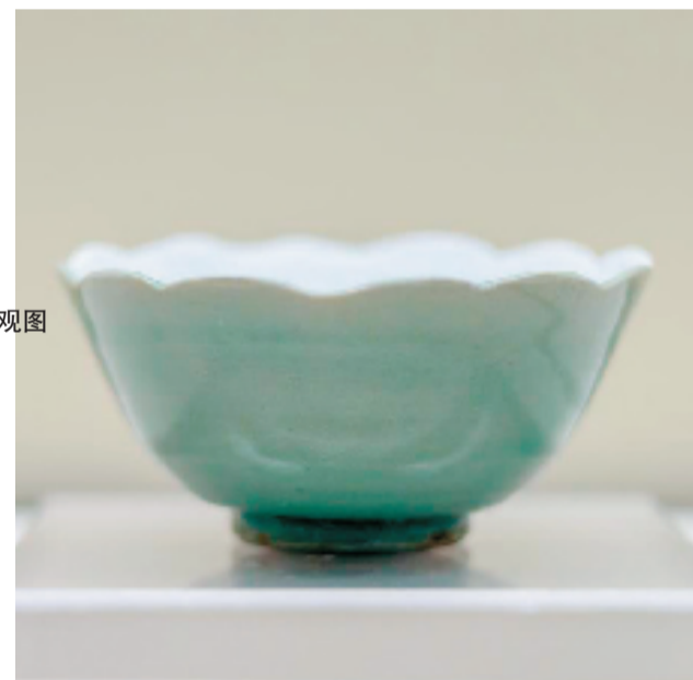
龙泉窑青釉葵口碗 杭州市文物考古研究所藏

本报讯 叶秋蕙 3月26日,“颂运·大运河诗路上的宋韵”在中国扇博物馆二楼临展厅展出。