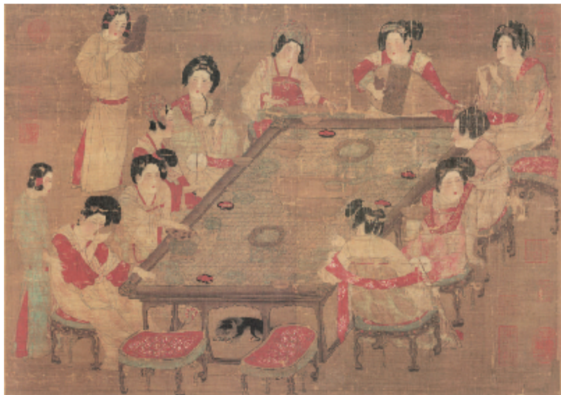
唐 佚名 唐人宫乐图 绢本设色 65×103cm 台北故宫博物院藏 台北唐画第二卷第一册