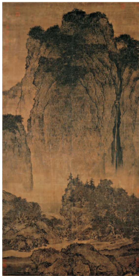
宋 范宽 溪山行旅图 绢本设色 180×104cm 台北故宫博物院藏 宋画全集第四卷第一册