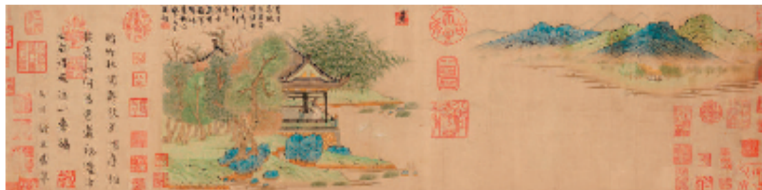
元 钱选 王羲之观鹅图 纸本设色 23.2×92.7cm 大都会博物馆藏 元画全集第五卷第三册