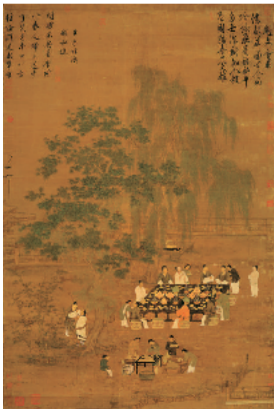
宋 赵佶 文会图 绢本设色 184.4×123.9cm 台北故宫博物院藏 宋画全集第四卷第三册