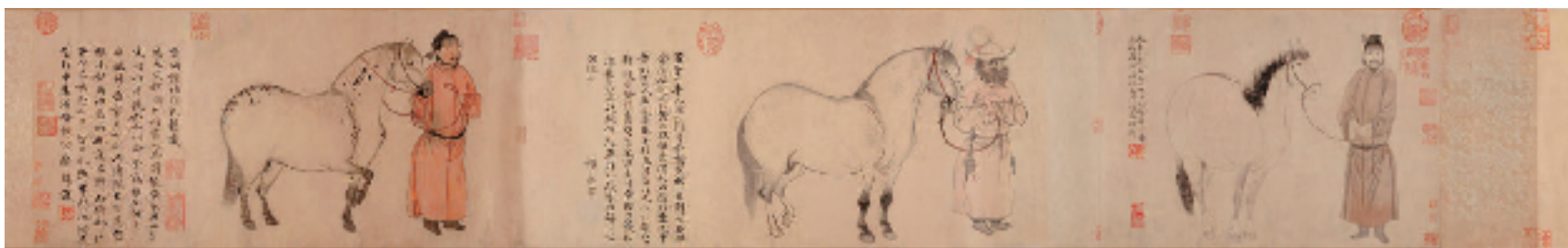
元 赵孟頫、赵雍、赵麟 赵氏三世人马图 纸本设色 30.2×178.1cm 大都会博物馆藏 元画全集第五卷第三册