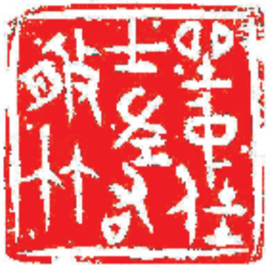
石力 篆刻 释文 坐中佳士左右修竹