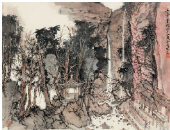
五峰书院 68x92cm 纸本设色 2021年

作品入选第八届、第九届、第十届、第十一届、第十二届全国美展并多次获奖，作品数十次参加全国名家邀请展、双年展、三年展等，出版个人画集和专著三十余部。