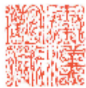
徐谷甫 鸟虫篆刻 释文 秦汉胡同

我爱“鸟虫篆”，“鸟虫篆”伴随我一个甲子！最近我的《鸟虫篆刻说文部首》业已杀青，出版后对印坛能贡献一份光与热是我所愿！