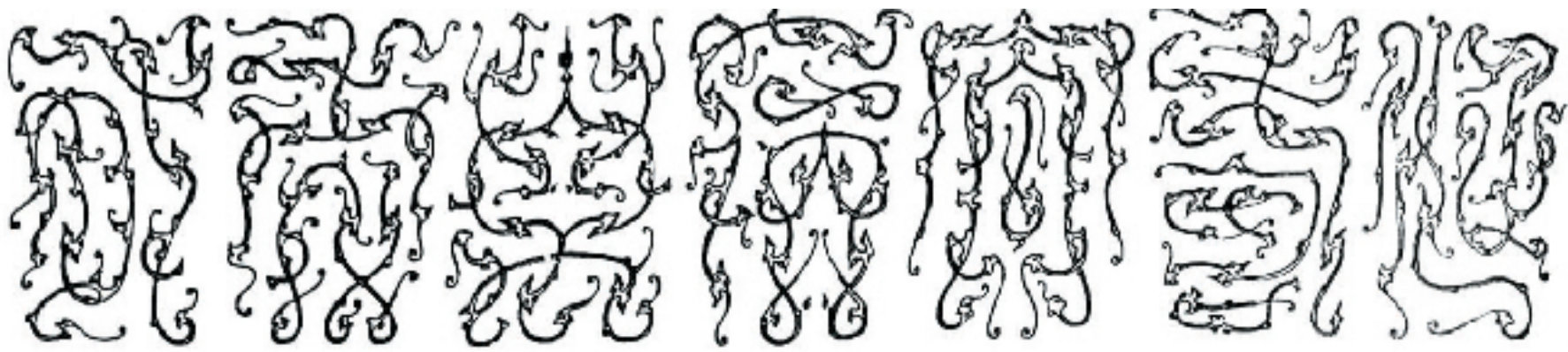
汉代“延寿去病万年有”鸟虫篆书