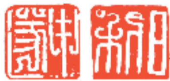
古代鸟虫篆刻 释文 申遂

尽脑汁！增损笔画、挪移部位、屈曲盘绕、刻意经营，唯有这样才能出好作品。当然印家如擅丹青，创作鸟虫篆印章会更便利一些，因为鸟虫篆的结构动态会更生动准确一些。要记住“随势设计”四个字中的“势”字最为重要！有了“势”才会有“灵”。“功夫在诗外”，多读书，多行路，加强自身文学修养也很重要，它会潜移默化地，天长地久地熏陶你不落“俗巢”！