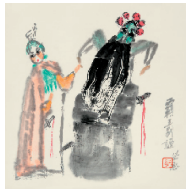
王德惠 霸王别姬 33x33cm