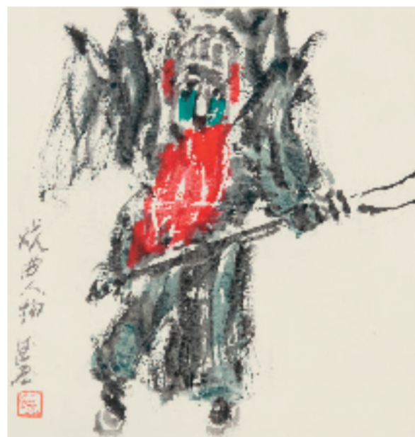
王德惠 戏曲人物 33x33cm