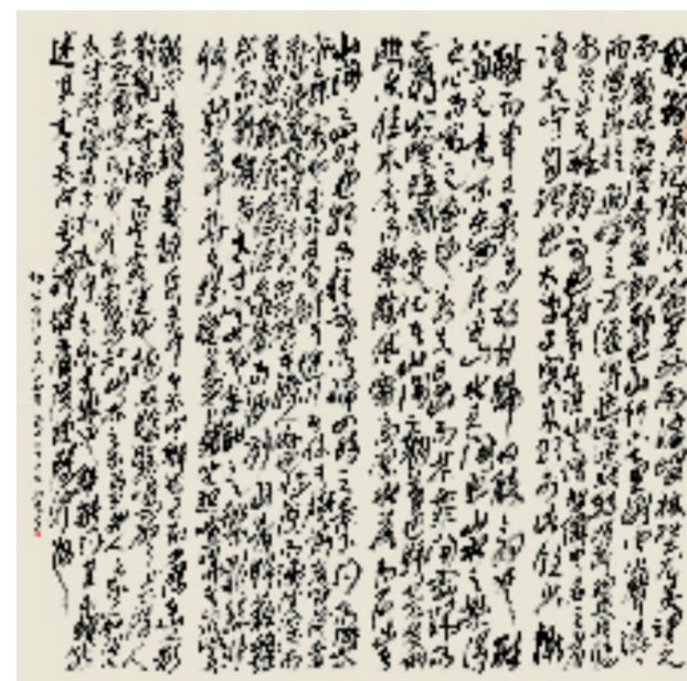
王德惠 醉翁亭记 270x70cmx4