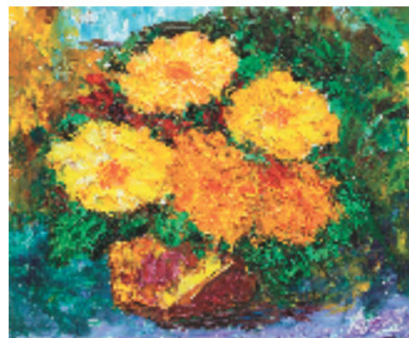
王德惠 瓶花 50x70cm