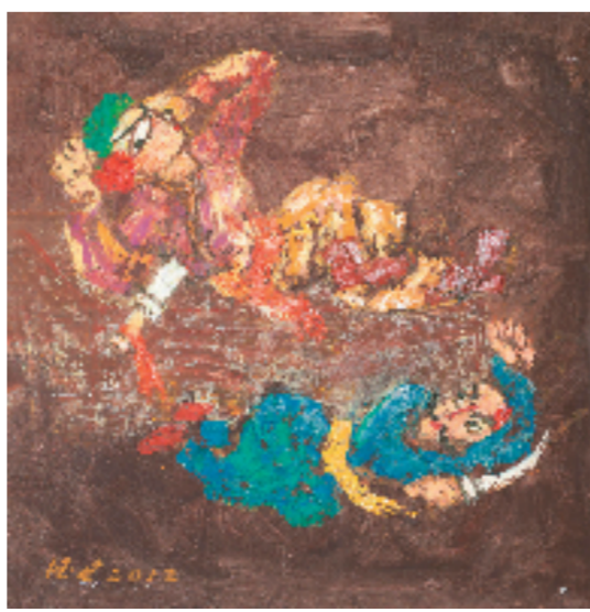
王德惠 三岔口 100x100cm 布面油画 2009年 中国美术馆收藏