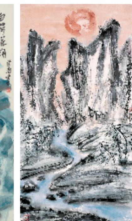
王德惠 红装素裹 138x70cm