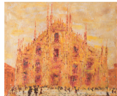
王德惠 米兰大教堂 33.5x38cm 布面油画 1999年 浙江天台博物馆收藏