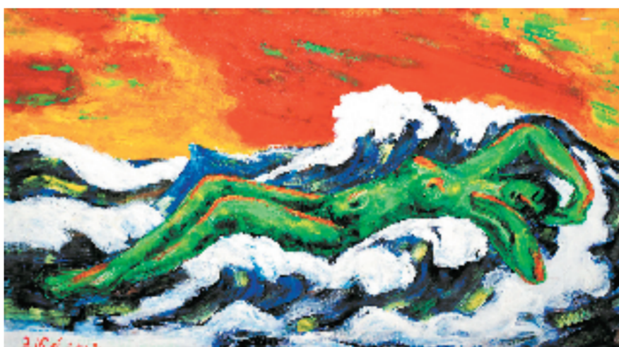
王德惠 大海风暴 90x160cm 布面油画 2005年 浙江美术馆收藏