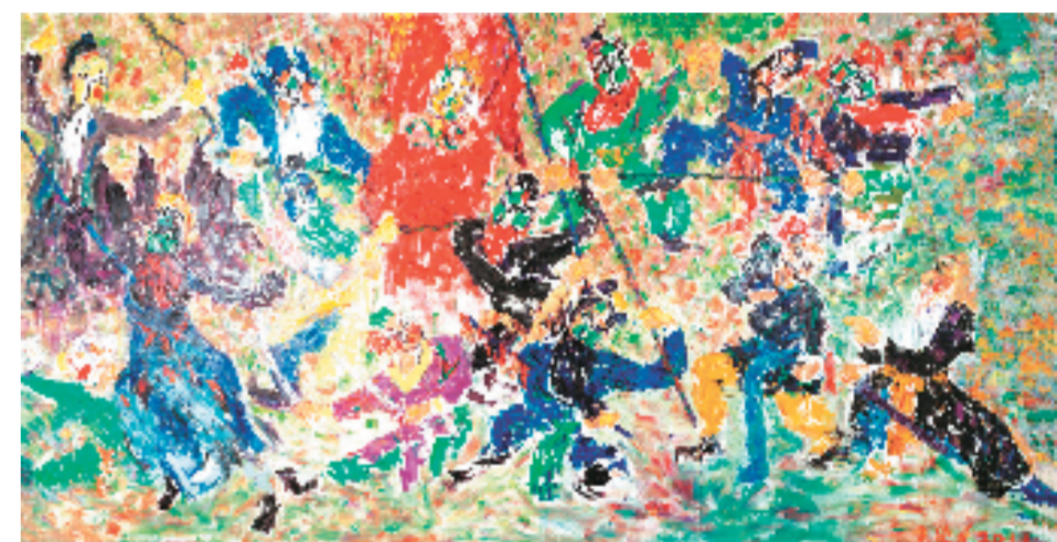
王德惠 打厮混 200x390cm 布面油画 2011年