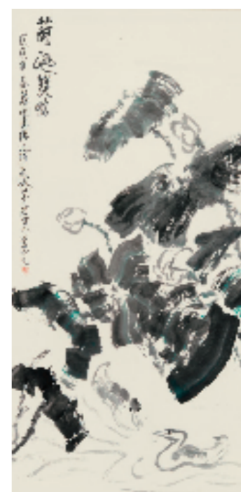
王德惠 池塘双鸭 180x97cm