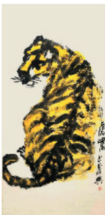
王德惠 虎啸 140x70cm