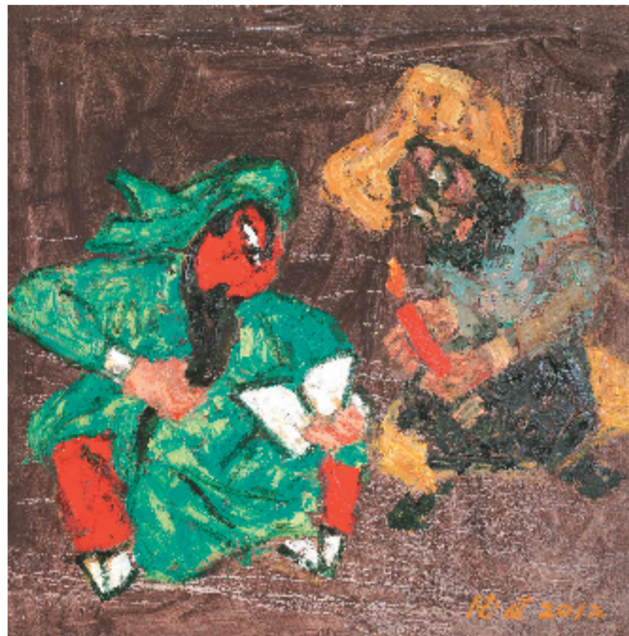
王德惠 读春秋 100x100cm 布面油画 2009年 中国美术馆收藏

适我无非新——“经过丰富的人生经历后，希望能以我的真诚，用我的画笔，永远描写出我的感受。(林风眠)”王德惠先生上世纪90年代中后期“夕阳红”艺术相册的突然红火，却并没有让其持续燃烧捞取利益，回避抛头露面，践行“见好就收”，他清楚艺术作品最终要靠时间与作品本身说话，需要寂寞守恒，切忌量产俗化，任何炒作都没有意义，这种胸臆极其难能可贵。王德惠先生令画坛惊叹的是他游历欧洲国家，欣赏到大量经典油画、雕塑、建筑归航回来一发不可收的系列油画作