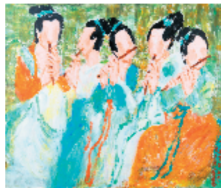
王德惠 仿夜宴图局部 95x110cm