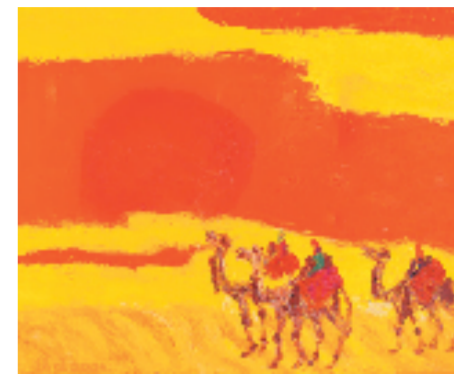
王德惠 大漠落日 73x90cm 布面油画 2005年 浙江美术馆收藏