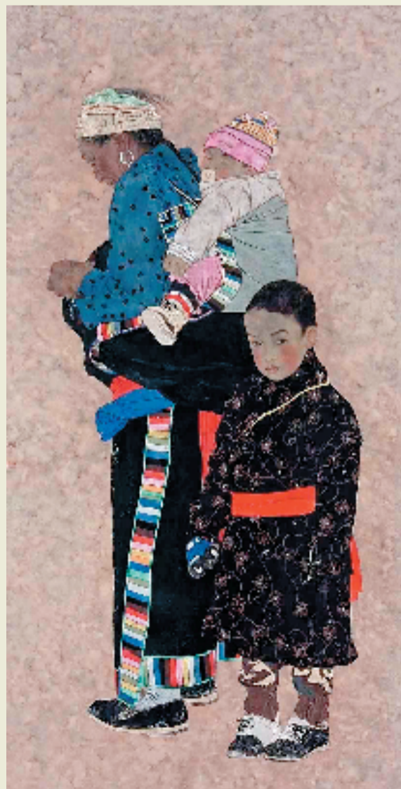
孙震生 五月阳光 180×90cm 中国画