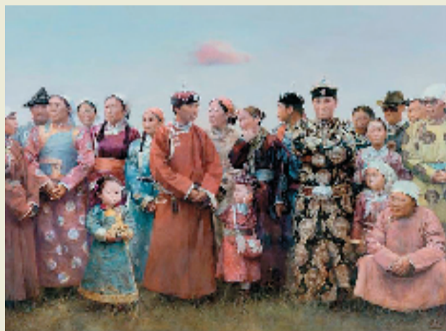
熊礼斌 草原上的人们 142×188cm 油画