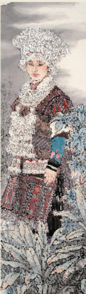
刘泉义 满地银光大瑶山 160×48cm 设色纸本