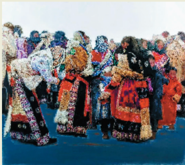
陆庆龙 格桑花开 180×200cm 油画