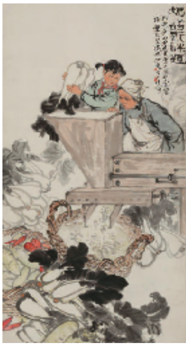
1960年 146x79cm 浙江美术馆藏

“传神妙笔绘巨作”、“生活蒙养筑根基”三个板块,呈现共计100余幅作品。展览中有其早期作品,也有中国美术学院收藏的《井冈山的斗争》《在大风大浪里成长》《凤凰山下十姑娘》《细流汇江海》《驯马图》等十余件作品为首次公开亮相,尤其值得关注。同时展出数件他早年的花鸟画作品,并结合其西画素描习作,来探讨浙派人物画造型与笔墨的根脉。