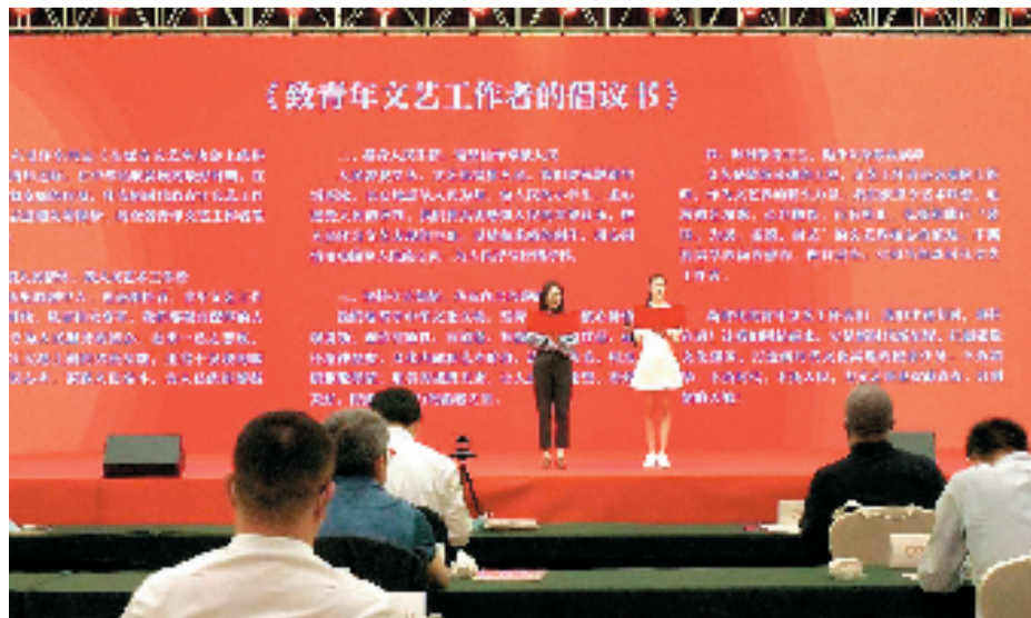
《致青年文艺工作者的倡议书》

活动现场还向青年文艺工作者发出倡议：厚植人民情怀，做人民文艺工作者；投身人民生活，精品佳作奉献人民；坚持守正创新，传达向上向善能量；时时修身正己，提升自身职业素养，青年文艺工作者们要立足新时代新征程，扛起建设文化强国、打造新时代文化高地的使命任务，为文艺事业贡献青春，开创新的天地。