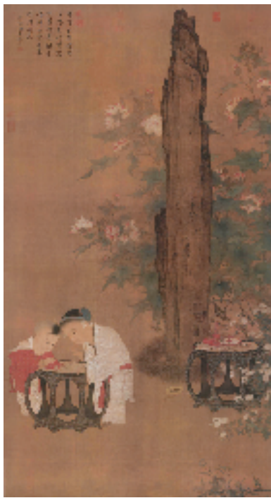
宋 苏汉臣 秋庭戏婴图 绢本 197.5×108cm

儿童题材在西方绘画中虽不如中国的“婴戏图”那样地位突出,但还是有不少绘画大师对此情有独钟的,并且创作出了相关经典名作。西方美术写实性表现手法的传入,影响和改变了我国儿童题材美术创作的整体面貌,这在当下的油画和工笔国画创作中表现尤为明显。艾轩和李自健等油画家笔下的儿童形象为许多人熟知,他们选取的人物背景虽然不同,人物的内心世界也有差异,但画中儿童与其所处的自然环境,都呈现出了一种诗性之美,尤其是儿童纯真无邪的眼神,能给人远离尘世喧嚣的感觉。在苍茫空灵背景下,艾轩作品中藏族儿童的深情凝视,能让人感受到诗和远方;李自健画笔下的儿童与自然一起构成了往日乡村的美好图景,在那里,人与自然和谐共生,中华文明所崇尚的淳朴亲情,更是体现了一种人性的光辉。近年来的工笔国画创作有不