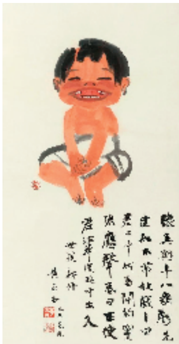
黄永玉 小童 国画