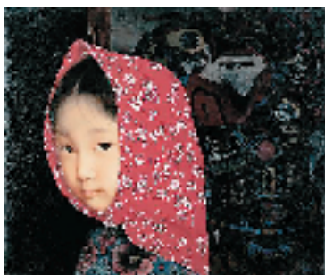
王沂东 沂蒙娃 布面油彩

儿童题材的美术作品让我们看到了生活理想的寄托,看到了不同时代的民俗风情,看到了社会的发展变化,更看到了儿童本身所固有的童真童趣,以及由此所体现的人间美好!儿童是人类的希望和未来,对成年人而言,关爱儿童便是关爱自己,现代儿童丰富多彩的生活使美术创作的儿童题材更为宽泛生动,相信新时代的美术家们会不负时代,能够用他们的丹青妙笔描绘出更多心系儿童的美好画卷!