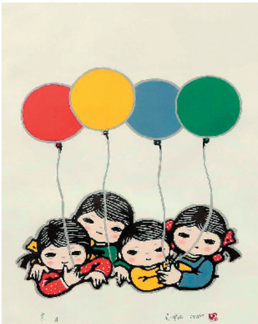
李平凡 节日 版画