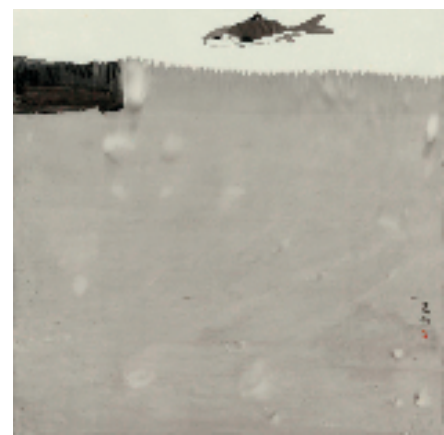
邓晔煌 飞龙在天 纸本水墨 69×69cm

本报杭州讯 效力 心雁杳杳——五人中国画作品联展,于5月28日在杭州雁庐艺术馆开幕。参展艺术家张靓亮、邓晔煌、叶剑波、王蓓蕾、潘杰,五人均为原墨社成员,展出作品自出新意,和而不同。原墨社是杭州余杭区分设之后成立的首家艺术团体,志复太炎先生“融贯中西,推陈出新”之学术精髓。此次画展的主办方为杭州市余杭区文化和广电旅游体育局,承办方为雁庐艺术馆和原墨社,协办方为杭州市余杭区美术家协会和杭州市余杭区章太炎故居纪念馆。据悉,展览将持续到6月8日。