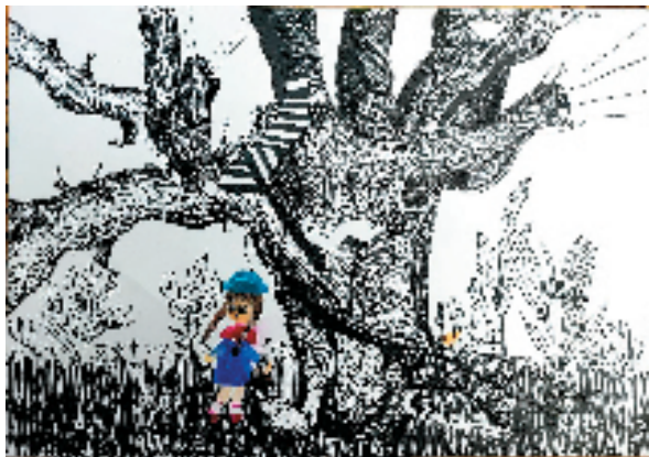
▲骆和平 11周岁 聆听 杭州市富阳区富春二小

点评: 这是一幅大色块搭配的儿童画,画面简洁明快,人物搭配合理,从主人公到形态各异的小人,均是圆圆的、胖胖的,充满喜感,细看主人公表情,满满地透露着我肥我快乐的自信。(靳长安)