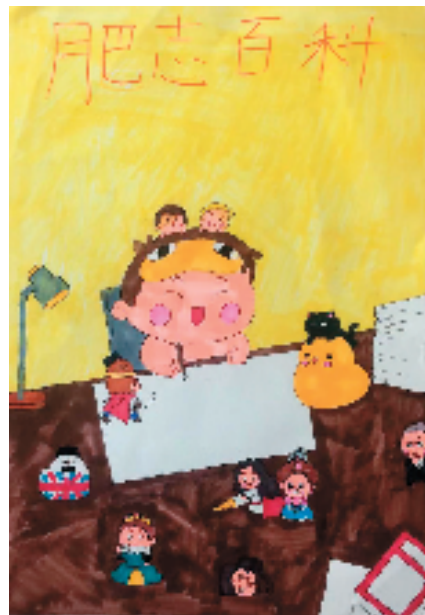
▲陈瑞阳 12岁 肥志百科 杭州市长江实验小学

点评: 这是一幅大色块搭配的儿童画,画面简洁明快,人物搭配合理,从主人公到形态各异的小人,均是圆圆的、胖胖的,充满喜感,细看主人公表情,满满地透露着我肥我快乐的自信。(靳长安)