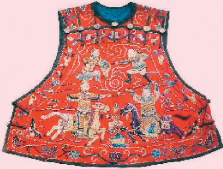
多种绣法卡拉呢人物纹一字襟坎肩正面

用各色布片组合而成、连缀起来的服装,称水田衣,或称百衲衣。为了保佑儿童健康成长,古代的家长便问诸家讨求布块,为儿童做成特定的百家衣,希望孩子托百家之福。