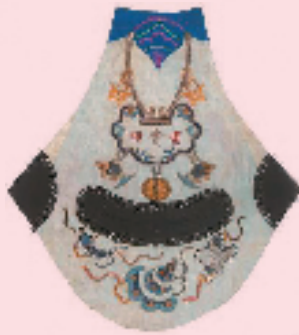
打子绣长命锁肚兜

这件肚兜是葫芦造型,葫芦因其藤蔓绵延,结果累累,籽粒繁多,故被象征祈求子孙万代的吉祥物。葫芦还谐音“福禄”,古人认为其可以祈福和驱邪。