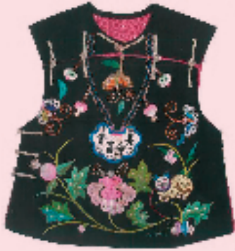
平针绣长命富贵、猫戏牡丹坎肩正面

坎肩就是我们现在所说的背心,古时也称马甲、半臂,有夹、棉两种,是为小孩遮挡风寒之用。有素面,也有精美的绣花,既保暖又漂亮,还有各种吉祥寓意。