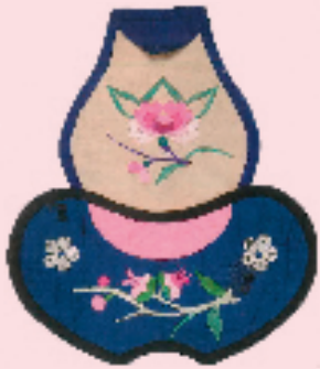
平针绣花卉葫芦形肚兜

肚兜这种形制的贴身内衣主要是保护胸腹部不受凉风。在冬季具有暖胃、护胸之功能,在夏季可直接外穿,形制简洁、实用,方便穿着,因此是儿童服饰不可或缺的一个品种。