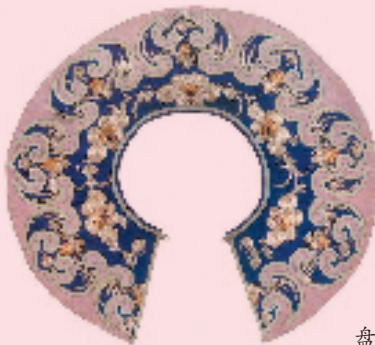
盘金秀蝙蝠花纹云肩

围涎,是围在小孩脖子上的护围,为防止口水污染衣服,相当于现在的围嘴。围涎因实用性和审美性兼具,在历经时间的洗礼后,造型更为丰富。不仅生动、有趣,还打破了传统造型片状拼接的模式,体现出中华民族劳动人民的勤劳和智慧。