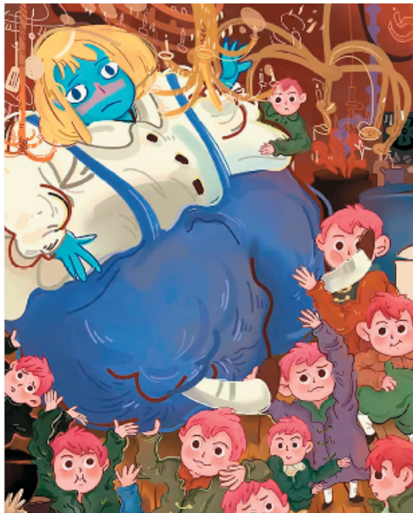
贾镇毓(浙江工商大学) 巧克力工厂 绘本