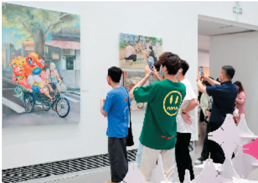
2022南通大学艺术学院毕业现场

勇于探索,发挥各自艺术才艺,追求鲜明个性,不断推进艺术创作的精深发展。他们以优秀的艺术作品,表达对社会关爱与对生活的热爱。毕业作品展是一场郑重的谢幕,同样是一场崭新的开幕,是同学们求学生涯的一个逗号,也是人生旅程新的启航。