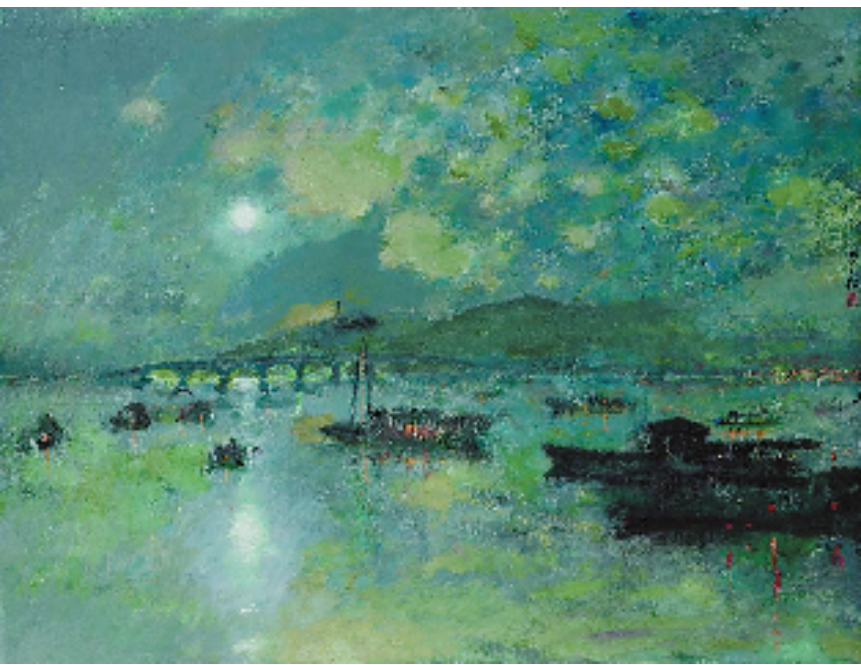
颜文樑 石湖串月 48×63cm 油画

本报苏州讯 效艺 万物苏萌山水醒,疫情已去,苏城全域回青,多馆陆续开新展,正是外出看展的好时光。