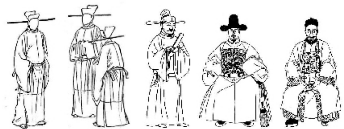
宋画中官员的常服样式