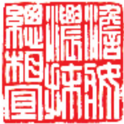
吴莹 篆刻 释文 淡妆浓抹总相宜