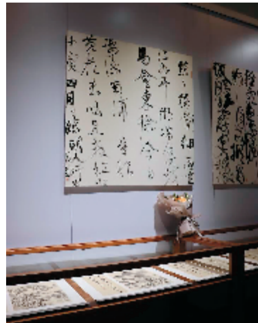
2022 浙江大学艺术与考古学院毕业展现场

据介绍,本次作品展共展出60余件/组书画作品,集中反映了美术系2022届毕业生群体的创作面貌,集聚了诸位老师的辛勤付出。就创作者而