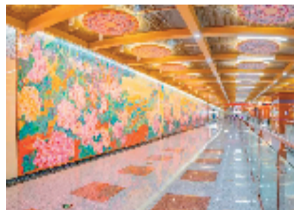
成都5号线皇花园站(壁画作者:吴松)