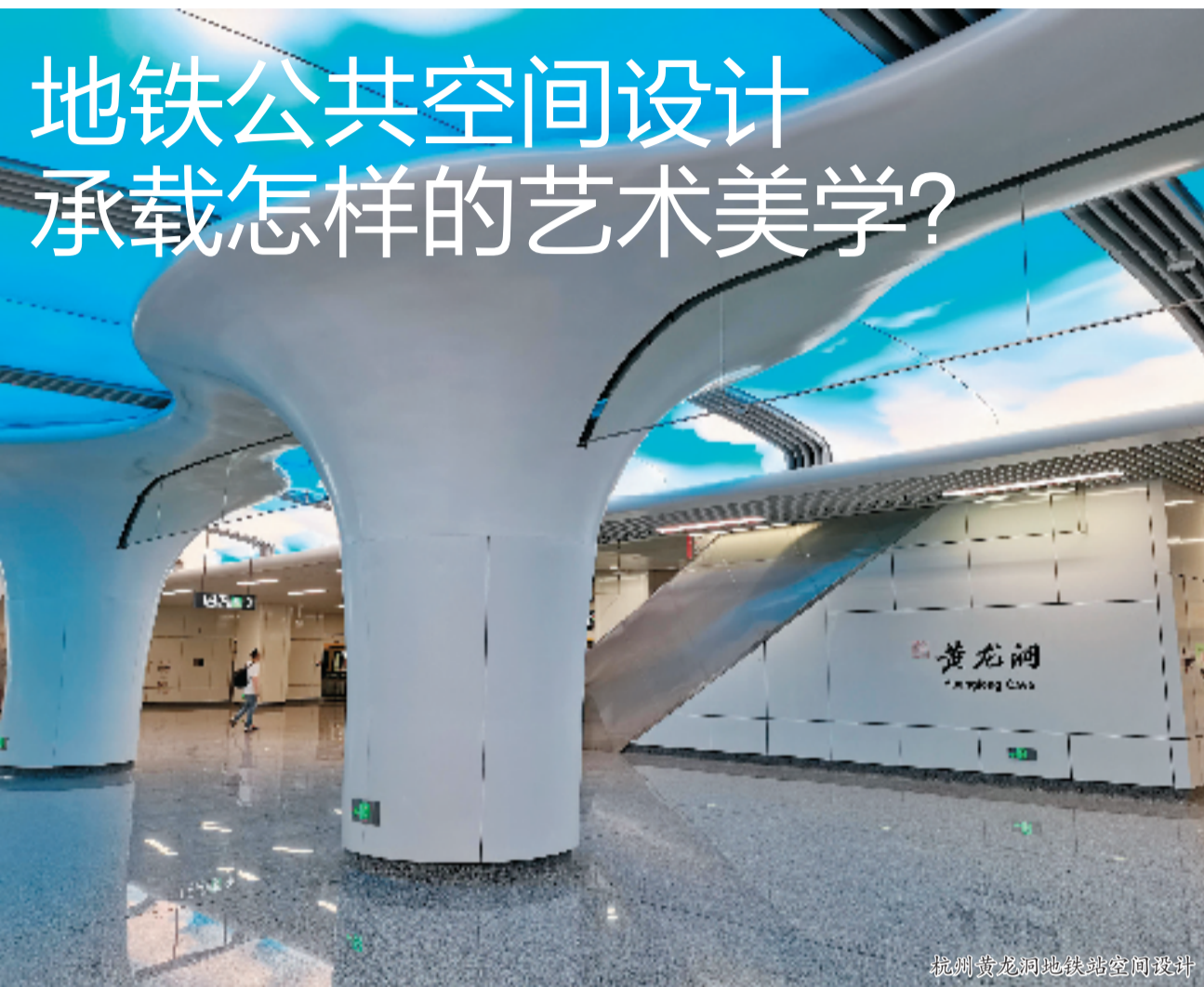
杭州黄龙洞地铁站空间设计

近日,连接西湖和西溪湿地景区的杭州地铁3号线后半段开通,其中透露出的宋韵文化和非遗,分外吸引人。此线路有着怎样一番景致?放眼全国,怎样运用中国元素和当地城市人文历史来规划地铁设计,国外有哪些值得借鉴的、颜值高的案例,人们需要怎么样的地铁交通环境?本期分享地铁空间设计中的智慧与美学。