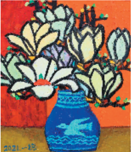
金一德 玉兰花之三 70×60cm 2021年

静物作为绘画的一个题材内容，贴近民生，融入生活，其亲近可感的审美价值具有广泛的社会承载面。与人物题材、风景题材乃至历史题材相比较，因静物题材的生活化更能获得普罗大众的亲睐和接受，所以对静物这种俯拾即是的油画题材，更值得艺术家们关注和探索。同时，当代社会生活面的铺展与艺术观念的开放，打开关于静物的定义与边界问题，也在中国油