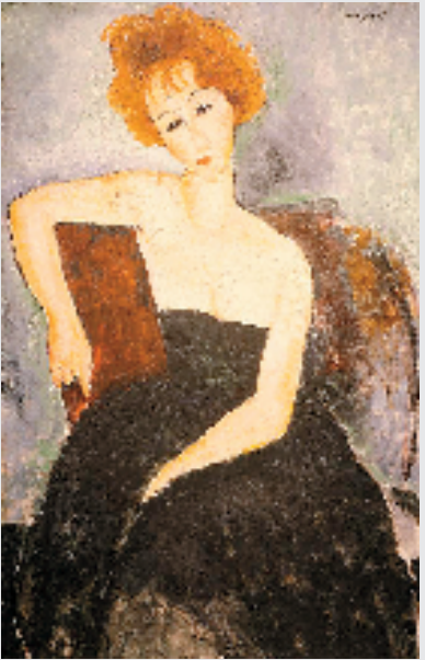
莫迪里阿尼 穿着晚礼服的红发女孩 89×69cm 版画 1915年

品同时展出，包括了水彩、版画、瓷器、装置、油画等不同媒材。 “洛克菲勒艺术基金收藏展：西方艺术大师”展览采用新型的展陈方式，5位西方大师的作品分属于不同颜色区域，并充分利用展陈空间，在安藤忠雄设计的筒状结构中，采用珠宝柜展出达利的“十二星盘”，且配以天幕打造整片星空。更多精彩，观众可亲临展厅自行挖掘。洛克菲勒艺术基金会将在震旦博物馆以系列展的模式，将跨越时代、流派、背景的东西方艺术，从上海推广至全国各地，完成“艺术赋能城市，文化带动产业”的任务使命。并今年计划在中国落地以“洛克菲勒艺术中心”为主的项目，以艺术文化、国际交流为核心，并逐步推进项目的筹划、建设，同时保证持续进行运营和相关服务。