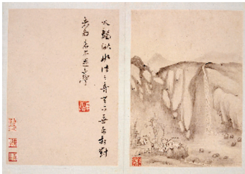
杨文骢 雁荡八景图册 24.5x17.5cm 纸本 墨笔