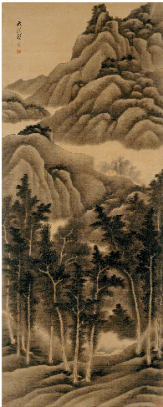
龚贤 夏山过雨图 清