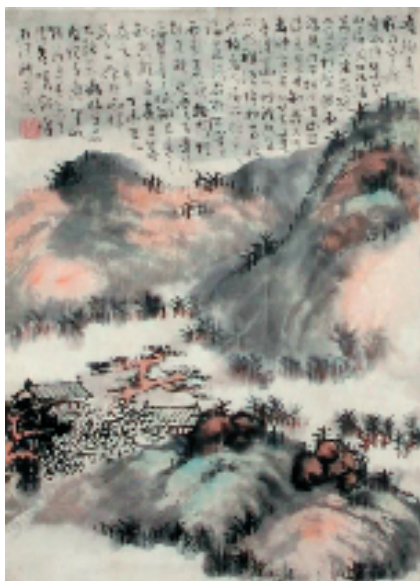
髡残 松岩楼阁图轴 41.6x30.3cm 纸本 设色