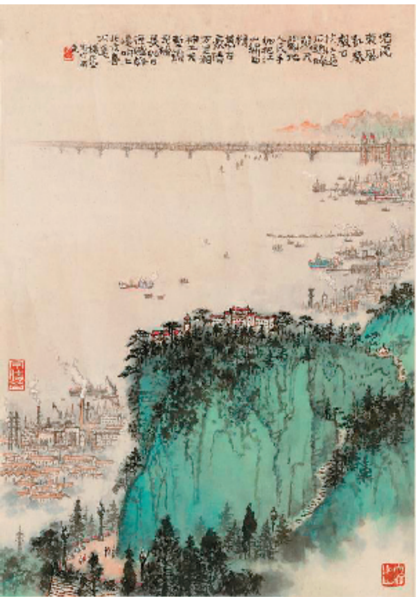
钱松喆 金陵雄姿图轴 52×36cm 纸本 设色 1970年代

20世纪中国画坛呈现了众多的流派,它们为推动中国画发展作出了不可磨灭的贡献。在这些流派中,以海上画派、京津画派、岭南画派、金陵画派、长安画派影响最大。新金陵画派是中国画坛最具影响力的绘画流派之一。