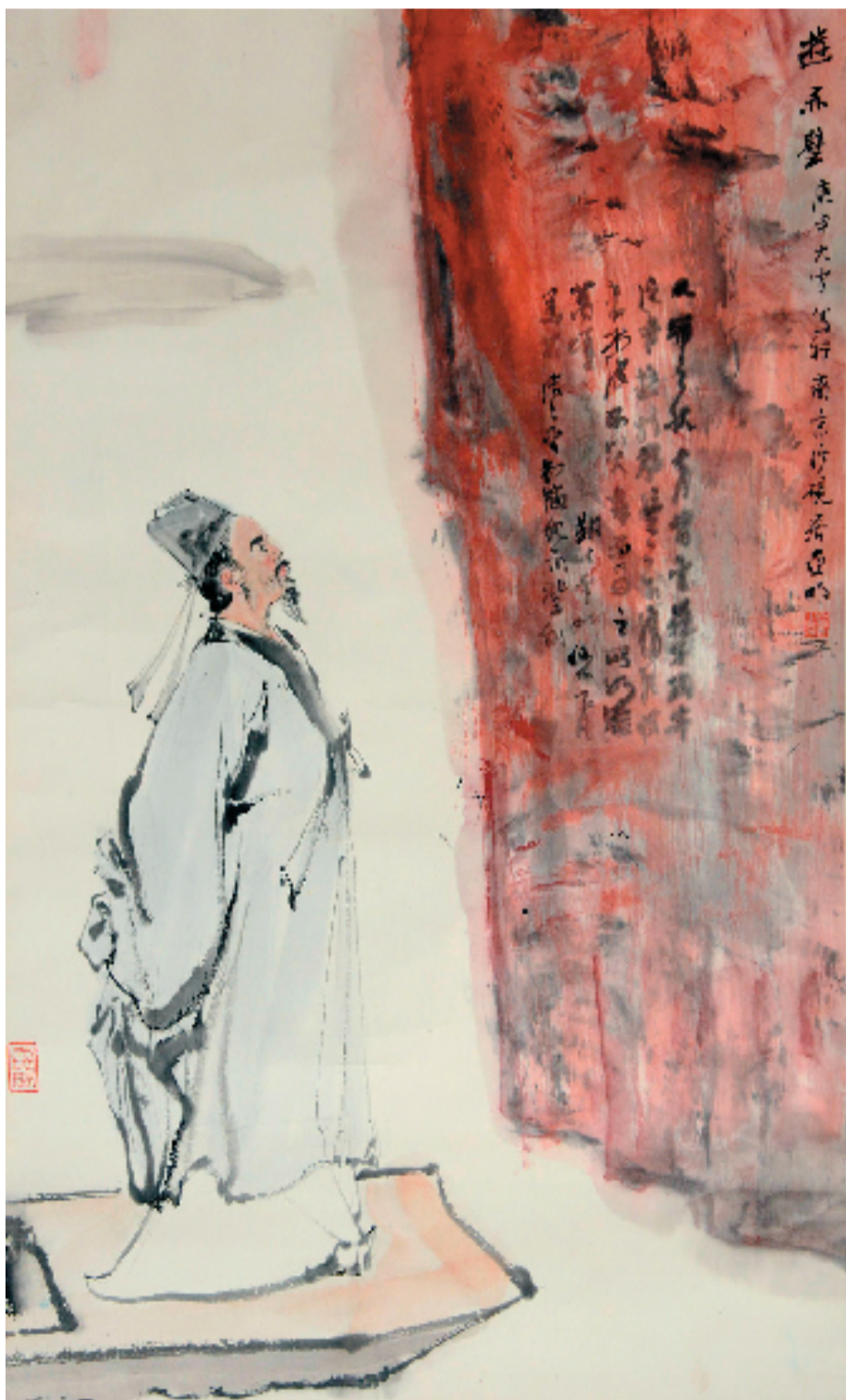
亚明 游赤壁图轴 67×45cm 纸本设色 1980年