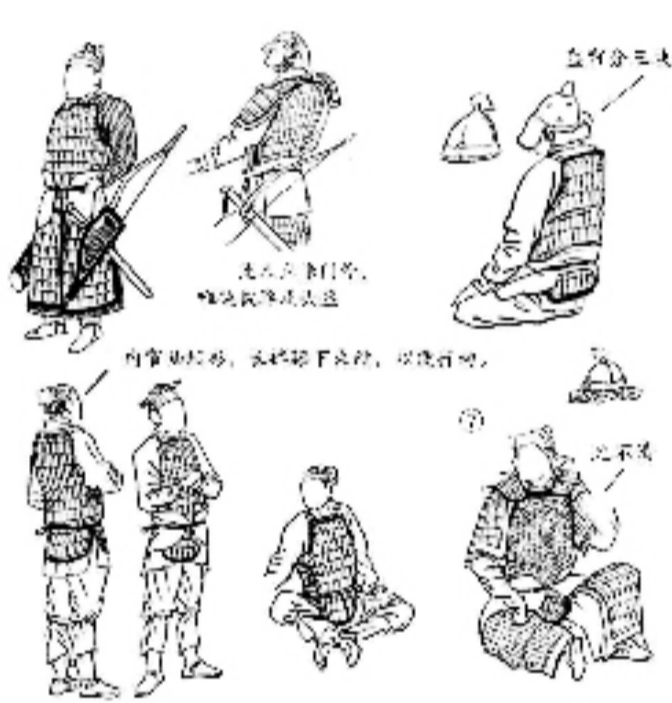
傅伯星临仿的萧照《中兴瑞应图》中,康王帐外警卫将士的盔甲