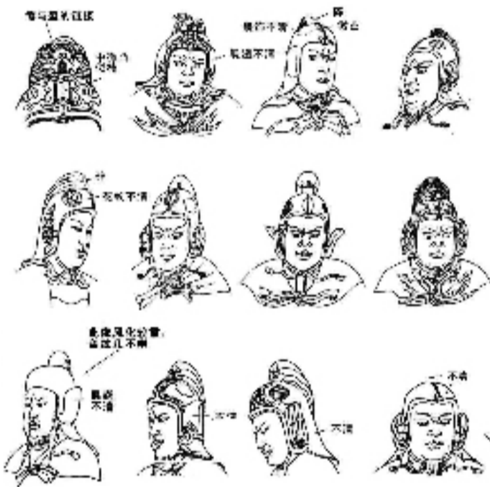
宁波东钱湖南宋墓道石雕将军盔式