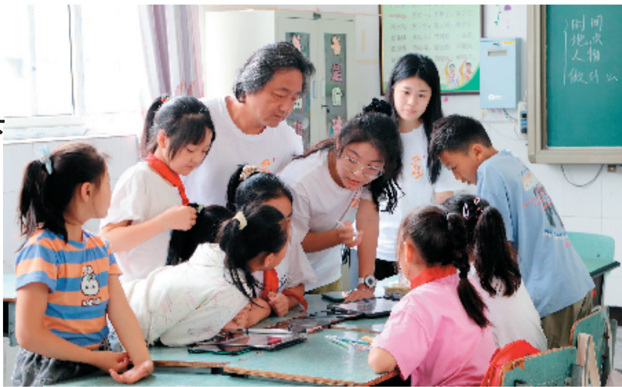
杭州师范大学美术学院开展暑期艺术支教

今年是杭州师范大学美术学院开展暑期艺术支教的第11年,美院支教团队不忘乡村美育初心,再次启程。经过前期层层选拔,支教队录取了14名来自不同专业、不同年级的优秀志愿者。跨越2000余公里,支教队来到四川省乐山市金口河区永和镇第二小学,开展“杭师援金 艺路同行”艺术支教社会实践活动。