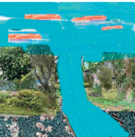
刘昊雨(四年级) 飞上天的大海 数字咔画 说明:海在天上,鱼在天上快乐地游泳,蚂蚁在地下勤劳地干活