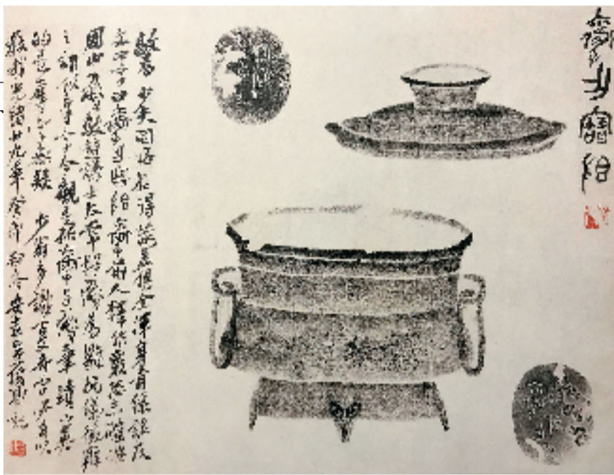
吴昌硕题青铜拓片立轴 高木圣雨捐赠

2019年,高木圣雨向西泠印社捐赠首任社长吴昌硕刻自用白文印“癖斯”一方,题青铜拓片立轴一件。