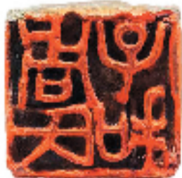
宋代细朱文印 周氏子和 戴丛洁捐赠

汉臂钏印“日利”,臂钏属镯类,戴于手腕处称“镯”,佩于臂上谓之“钏”,存世较少。通过此类造型的印章,可窥见古人生活装饰与印章实用的结合。