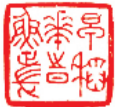
王封 早稻花时鱼正长