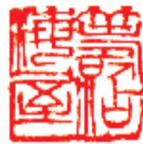
周铁衡 篆刻 释文 筹添海屋

诸方面的热情与成就,回顾了父母的坎坷人生,情真意切,令人感动。周铁衡家世交、西泠印社社员韩天雍分享了周铁衡16岁在法源寺拜齐白石为师的背景,生动讲述了周在日本留学期间的往事与达到的艺术成就。策展人茅大为认为,齐白