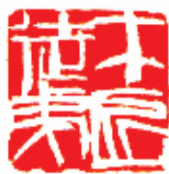
齐白石 篆刻 释文 木匠徒弟

此次特展共展出齐白石与周铁衡作品70余件,既是致敬先贤所留存的文化艺术宝藏,使后人了解周铁衡的艺术面貌、进一步认识齐白石艺术的传播与影响,也展示出西泠印社对金石文化一以贯之的传承与发扬。齐白石弟子周铁衡家属周维新在发言中表达了对父亲的怀念与憧憬。他讲述了父亲周铁衡在金石学、古文学、考古学、古琴弹奏