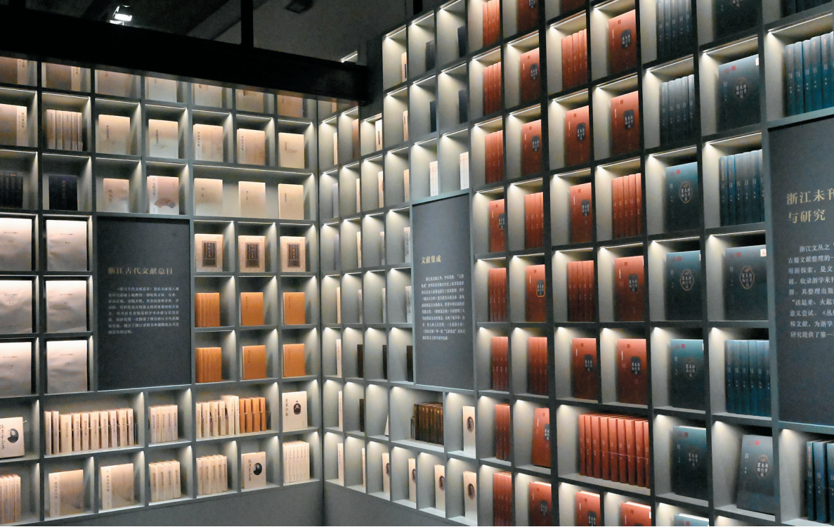
记图为版本馆各个展厅一瞥