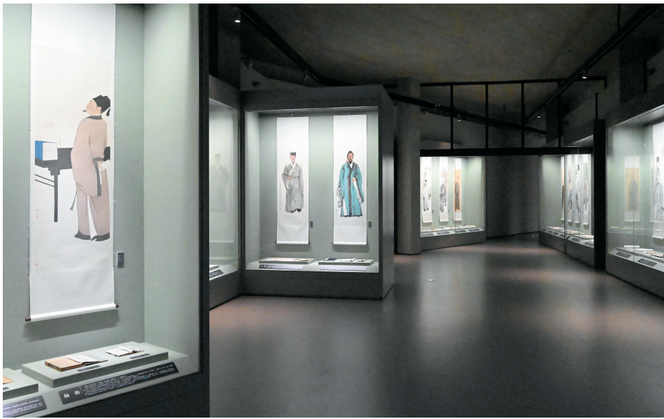
“千古风流——浙江历史文化名人展”展厅一角

同组成浙江人的精神图谱,也是浙江历史文化发展的悠久画卷。 在作品征集阶段,策展团队也有意扩大创作者的覆盖面,横跨老中青群体,面向全省各地市的美协、画院、学校等机构组织以及个人,参展的创作者中既有资深名家,也有年轻新秀。每件作品都经过专家委员会的评审建议,有些甚至多次修改,最终为观众呈现出179幅生动传神的人物画像。其中中国画66幅,绘画对象主要为古代名人;版画113幅,以水印木刻为主,大多是近现代人物。灵动优美的笔触与刻痕,鲜活地表现出名人伟大的精神和闪耀的成就。 这不仅仅是绘画作品展,每位人物以画像、小传、版本信息为基本陈列单位,除画像外还展出名人相关的古籍、拓片、手稿、书信等版本近300余件,全面系统、生动形象地展示这些浙江历史文化名人的贡献和影响。每件版本文物的存在,也都时刻体现版本馆的独特作用,向人们传递着版本文化和版本理念。 据悉,“千古风流——浙江历史文化名人展”的展期暂定为一年,趁此机会,不妨来到杭州良渚,游览宋韵建筑,体会版本魅力,一睹名人风采。