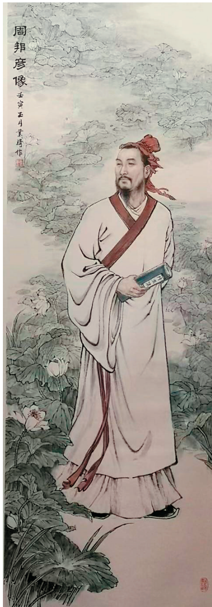
何业琦 周邦彦 160×55cm