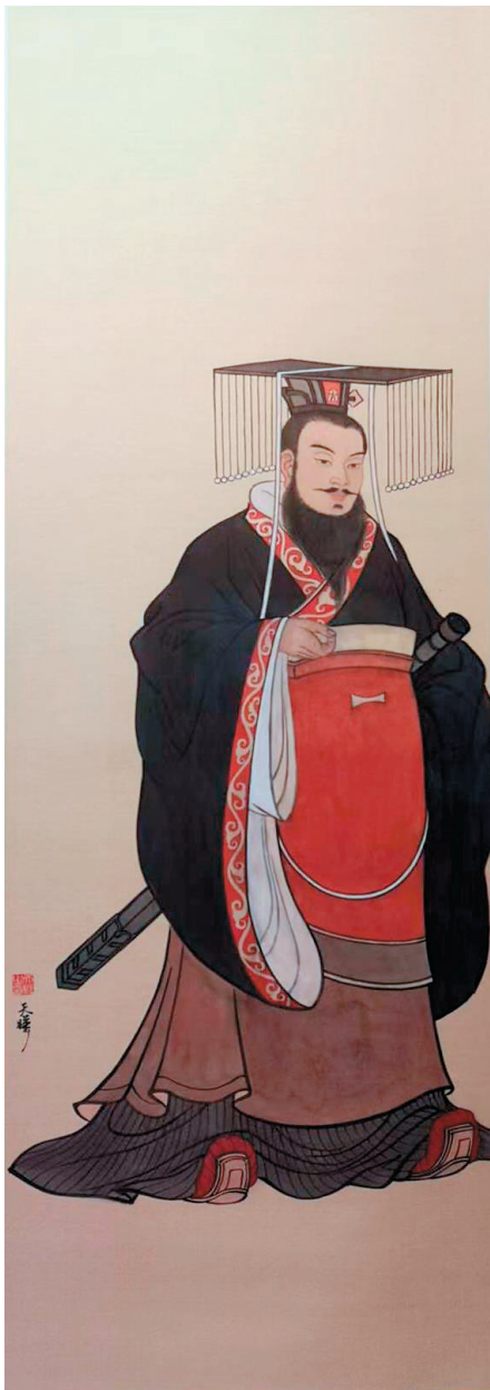
盛天晔 孙权 160×55cm