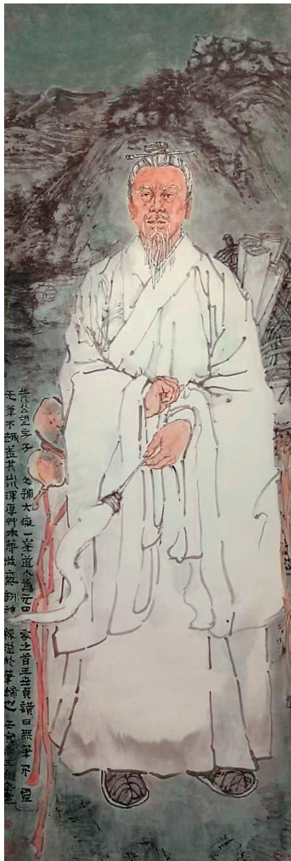
王剑武 黄公望 160×55cm