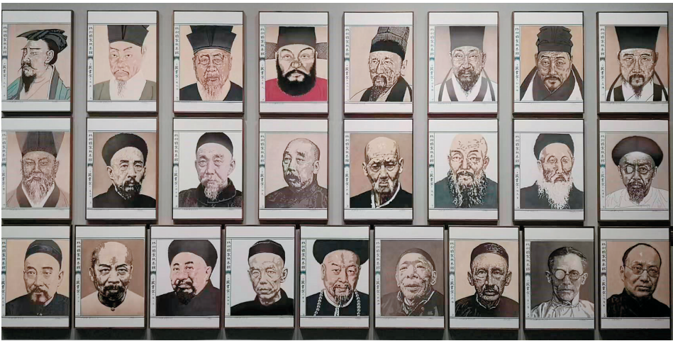
部分版画名人画像