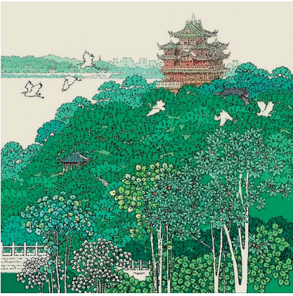
孙晴义 城隍阁 52x52cm

刘工既是当代艺术家,亦是自由作家。其油画作品收录于《中国油画名家》《中国收藏》《当代油画》等专辑。出版《当代油画·刘工专辑》《野性与色彩》,长