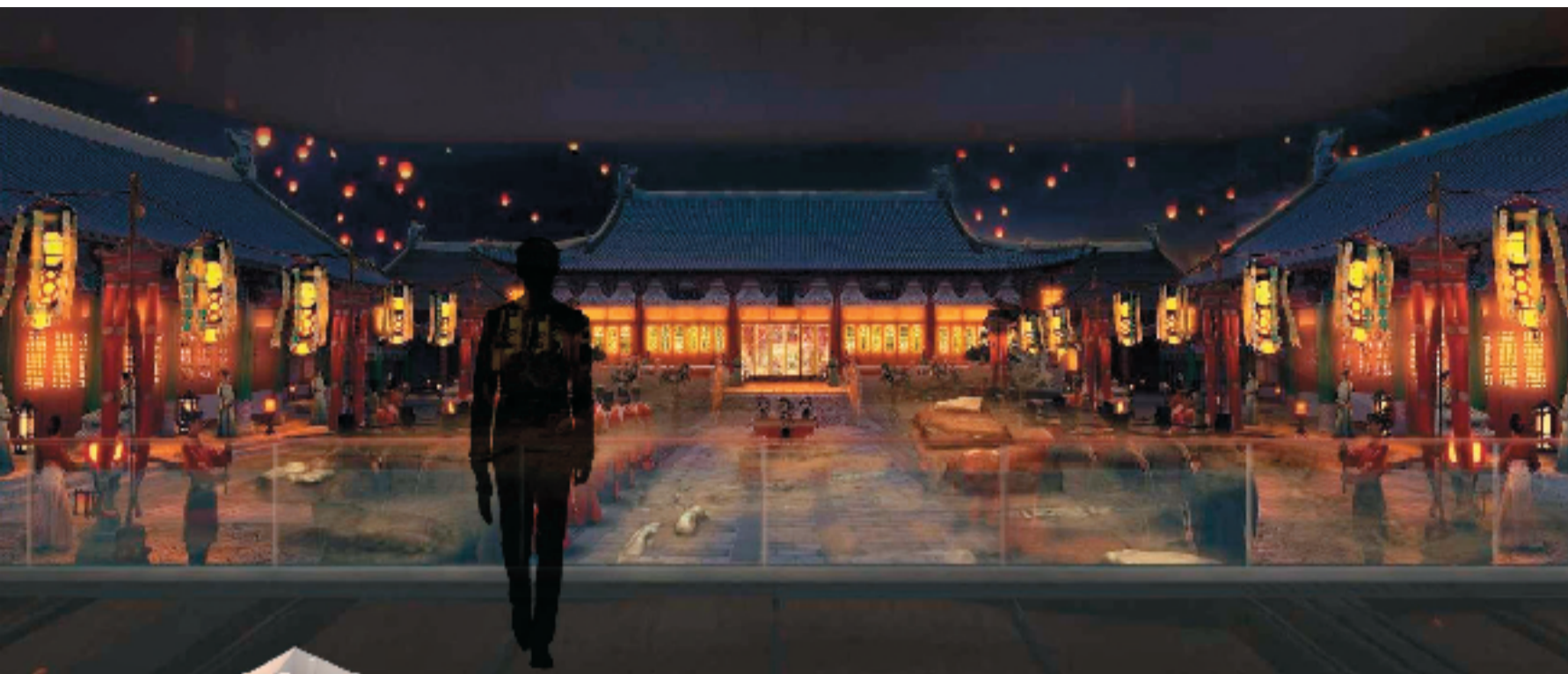
南宋德寿宫中区遗址数字展陈效果图。