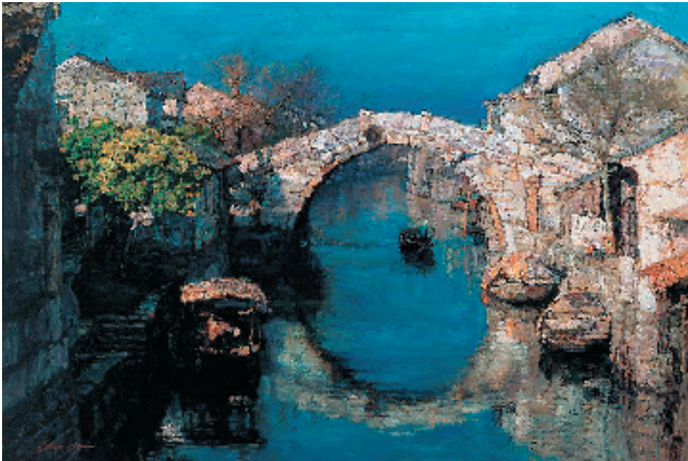
陈逸飞 周庄风景 油画

本期,我们选择了一些具有代表性的知名艺术家表现全国风景名胜的绘画作品,以一场画中游的方式“出行”,对于碍于疫情只能在家避暑的人,不用车马劳顿,不用下榻,不用防晒,不用果腹,来一场精神上的“卧游”,聊以慰藉向往诗和远方的那颗躁动的心。