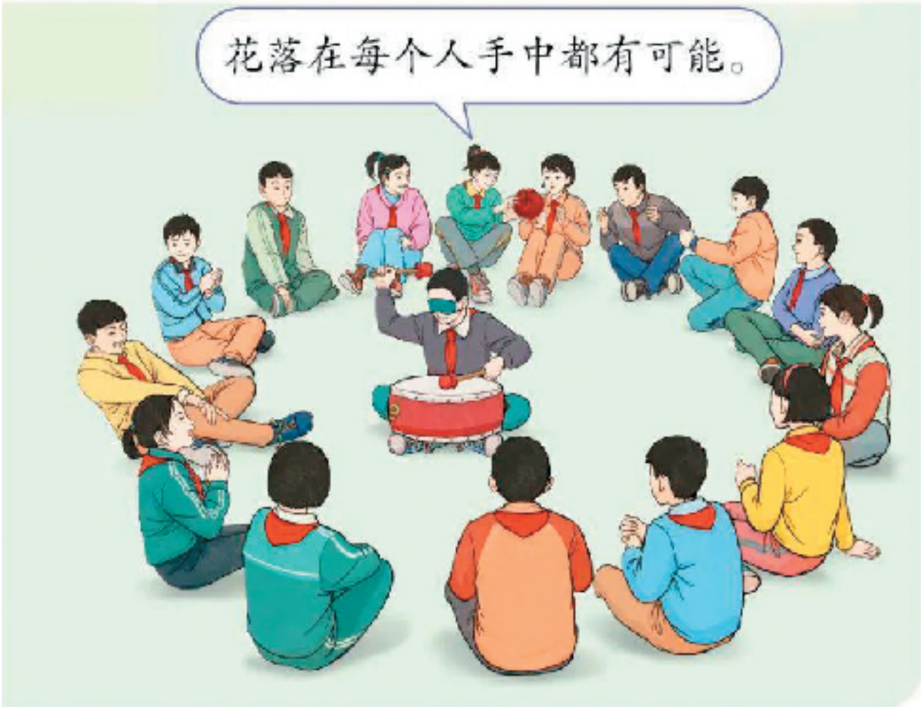
选自人教版小学数学新教材五年级上册，在传统的击鼓传花游戏活动中让学生体会随机现象

5月下旬启动并于日前完成小学数学教材插图重绘工作，将全力确保2022年9月新学期课前到书。