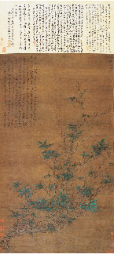
元代 李衍 纤竹图 广州艺术博物院藏

此次展览中,能看到一系列与苏轼相关的重要展品,如:《东坡笠屐像》石刻、苏轼《表忠观碑》(宋刻、明刻)、苏轼《诸城密州题名》、苏轼《黄州谢表》、《归