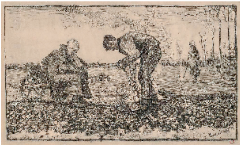
文森特·威廉·梵高 烧野草 平版印刷 1883年

本报综合讯 报艺 日前,大都会艺术博物馆“馆藏素描与版画展”正展出近期购入的新藏品,包括荷兰画家文森特·威廉·梵高、彼埃·蒙德里安、挪威画家爱德华·蒙克的画作。策展人还选出一批19至21世纪的荷兰艺术家作品进行展出。大都会艺术博物馆收藏超过100万件素描与版画作品,这些脆弱的纸质作品无法长期暴露在展厅的光线环境中,