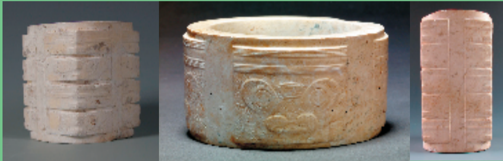
高矮、大小、不同质地的玉琮器

良渚文化最突出的就是有大量玉器出土，因此良渚文化也被称为“玉文化”。良渚文化遗址群中如反山、瑶山遗址中都出土了很多玉琮器。玉琮器的原型是玉镯，兽面纹也是最初的纹样。既有定位为早期的圆筒形器和具体完整的神人兽面纹样，又有四角分明的内圆外方形器，以及抽象的神人兽面纹。全国很多博物馆收藏了各种高矮、大小、不同质地的玉琮器。