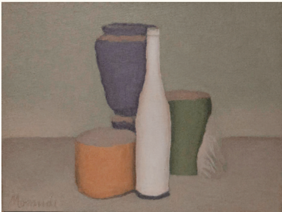
乔治·莫兰迪 静物画 30.4×40.5cm 布面油画1960年

莫迪里阿尼的父亲是银行家,在他出生后,父亲破产自杀。母亲看出孩子的艺术天赋,着意培养他,带他出入乌菲兹美术馆学习古典艺术。他一生的作品中大部分是人物画。他的人物通常不画瞳孔——“有眼无珠”。塞尚的肖像画也有很多不画瞳孔,那是他为了表达结构与颜色,避免把注意力放在人物情绪、个性、身份上。而我们通过莫迪里阿尼不画瞳孔的眼睛却仿佛可以洞悉人物的灵魂。正如他自己所说:塞尚的人物,就像古代最好的雕塑一样,是不用眼睛看的。我的,则相反,他们在看。即使我有时不画瞳孔,他们也在看。