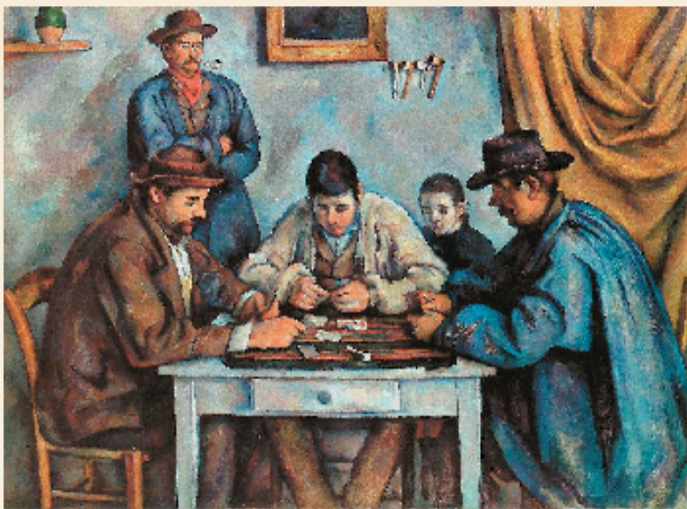
保罗·塞尚 玩纸牌的人 1890-1892年 巴恩斯基金会藏