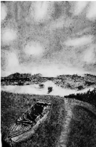
吴易霖(东阳市外国语学校九年级8班 15岁) 瞭望 素描