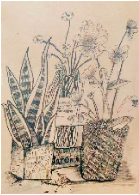
吴易霖(东阳市外国语学校九年级8班 15岁) 花卉 素描