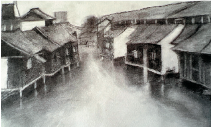
吴易霖(东阳市外国语学校九年级8班 15岁) 水云间 素描