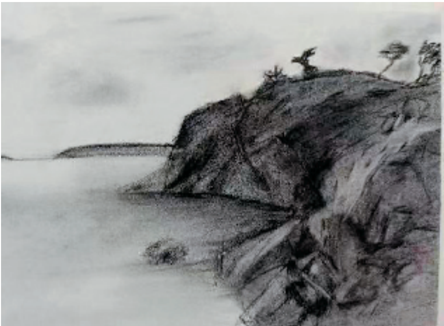
吴易霖(东阳市外国语学校九年级8班 15岁) 风景 素描