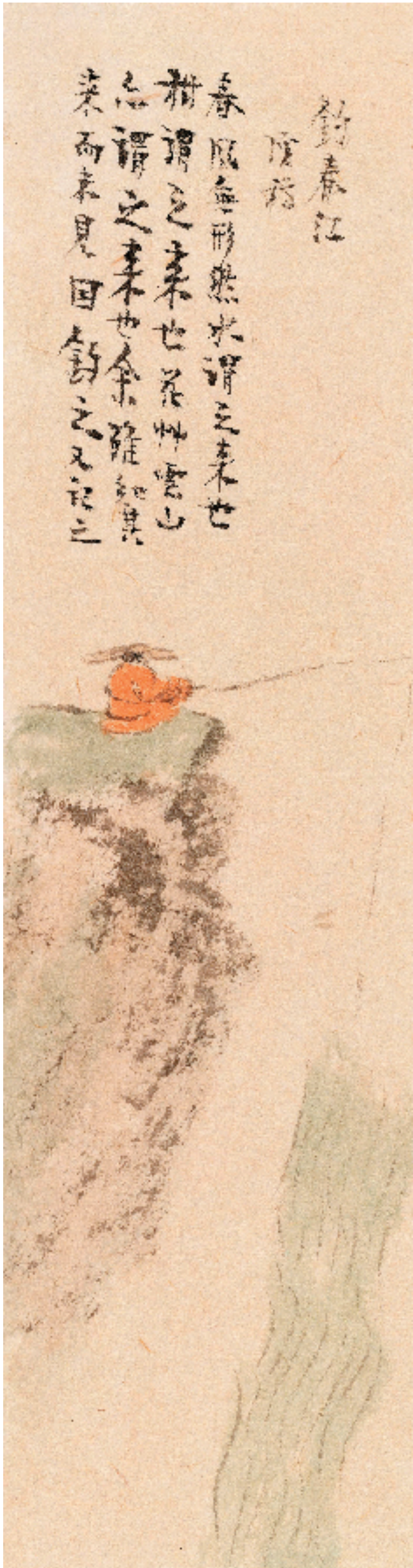
周祥林 山水偶趣之一