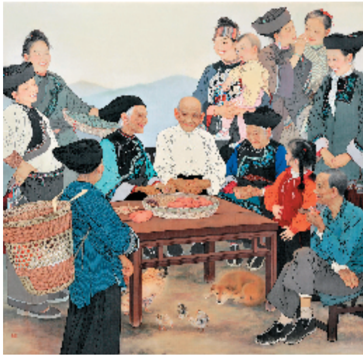
赵胜琛 春晖 196×192cm 中国画 2019年

本报讯 俞越 9月1日晚,由文化和旅游部、北京市人民政府、天津市人民政府、河北省人民政府共同主办的第十三届中国艺术节正式拉开帷幕。本次艺术节以“艺术的盛会 人民的节日”为宗旨,秉承“创新、开放、精品、共享、融合”办节原则,线上线下结合,演出直播并举,举办开闭幕式、艺术评奖、特邀剧目展演、纪念毛泽东同志《在延安文艺座谈会上的讲话》发表80周年主题展、美术作品展、全国演艺及文创产品博览会等主体活动。据悉,本次艺术节期间,有来自全国各地的优秀舞台艺术作品进行展演,包括文华奖参评作品58部(台)、特邀剧目26部(台)、群星奖参评作品100余个。