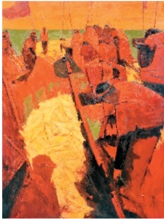
徐伟 胶东秋捕 120×160cm 油画 2020年