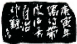
邵磊 篆刻 释文 晋阳怡斋邵三石之玺(连款)