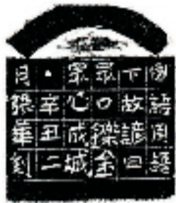
张华 篆刻 释文 成城烁金(连款)