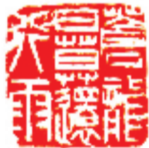
李大勇 篆刻 释文 苍龙日暮还行雨