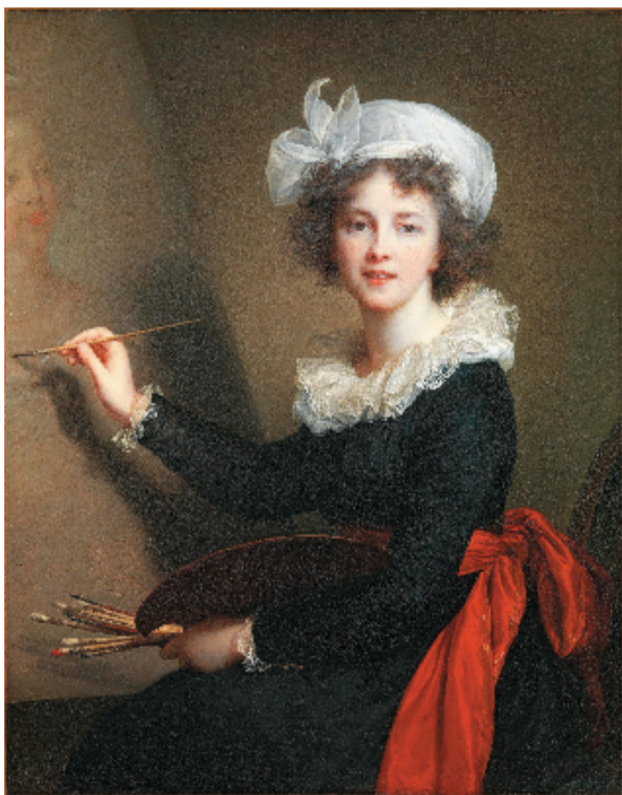
理 略 伊 维 南 100x80cm 1796年

展览以时间为线索,通过展现西方艺术史上一系列名家大师的自我写照,揭示了西方绘画艺术的历史变迁。展出作品包括《拉斐尔自画像》《委拉斯开兹自画像》《伦勃朗自画像》《夏加尔自画像》《草间弥生自画像》等,其中《拉斐尔自画像》是拉斐尔最著名的画作之一,此次展览也是这件举世闻名的画作首次亮相上海。展览持续四个月,于2023年1月8日闭展。