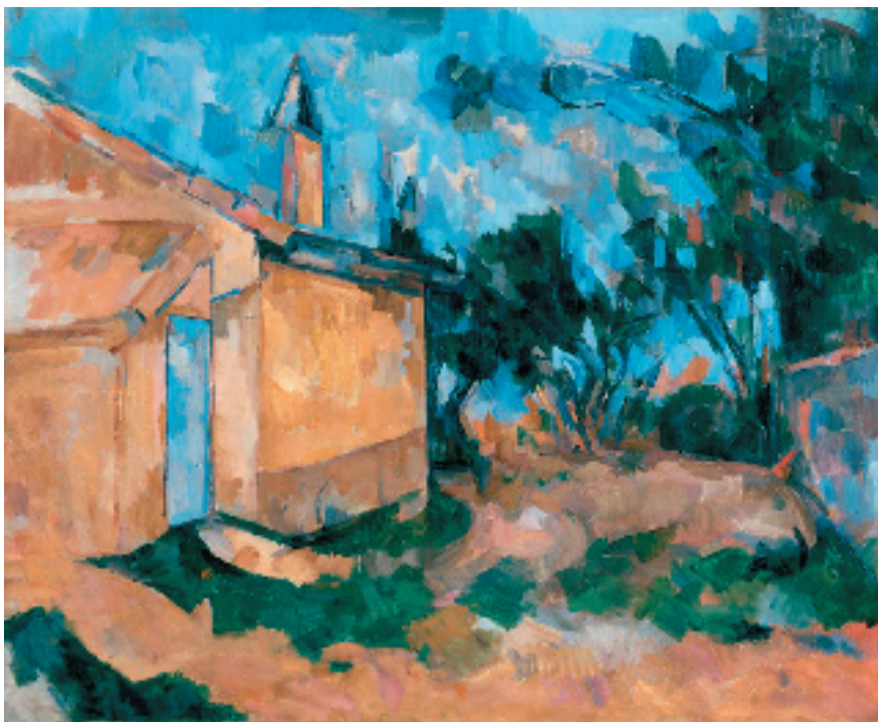
保罗·塞尚 儒而当的乡间小屋 65×81cm 布面油画 1906年

同样是刻画女性,这幅《侧卧的裸女》则向我们展露了放松慵懒的状态。此画作是意大利表现主义代表艺术家之一阿梅代奥·莫迪利阿尼(Amedeo Modigliani)