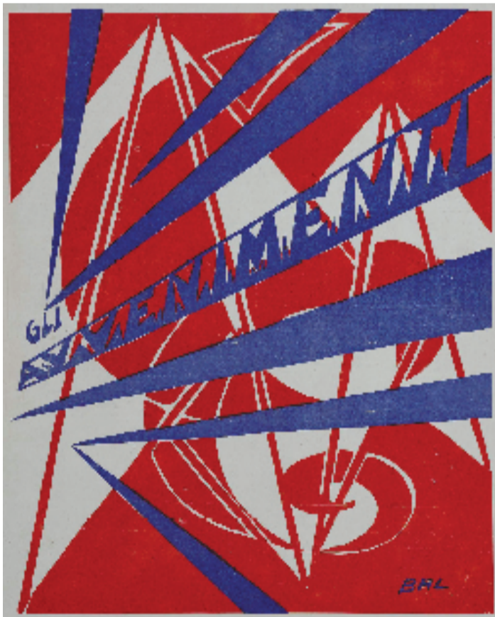
贾科莫·巴拉 事件 纸本彩色平板印刷 40×30cm 1916年