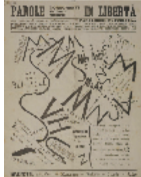
菲利波·托马索·马里内蒂 自由的言语 29×23cm 1915年