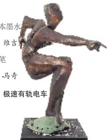
青铜 103×46×40cm 1929-1931年