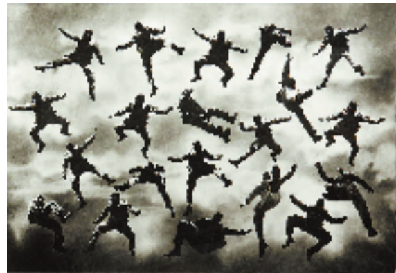
布鲁诺·穆纳里 和飞行救生员一起体验跳伞特技 复古明胶银印 15×21cm 约1930年 飞翔