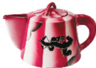
罗曼蒂陶瓷公司 茶壶 施釉陶瓷 15×20cm 约1930年