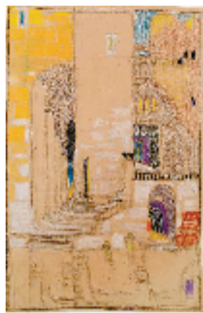
安东尼奥·圣埃利亚 未来主义者的威尼斯 彩色纸本铅笔 39.5×25.7cm 约1914年