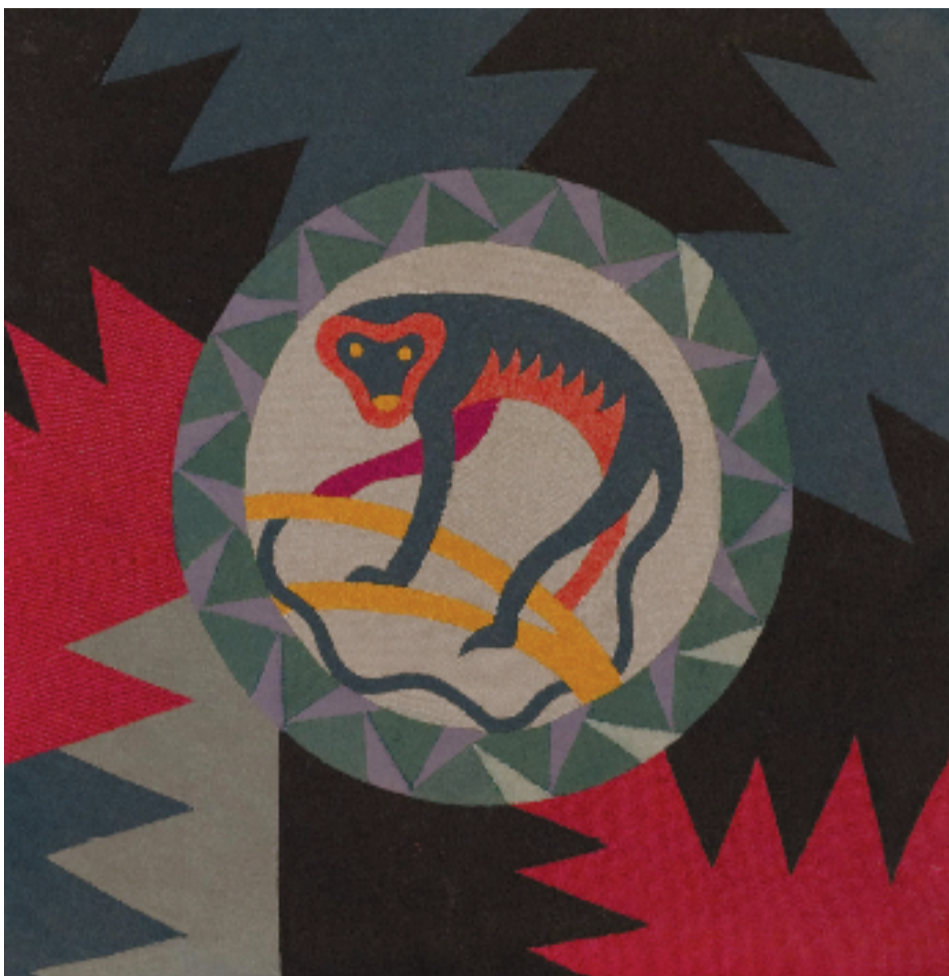
福图纳托·德佩罗 猕猴 嵌花织物 57×55.5cm 1923年

历史若没有思想的指引，必定是浑浑噩噩的反复轮回；思想离不开实践，唯有实践方能创造出筑就新时代的物质颗粒；未来主义运动也告诉我们，思想离不开传播，广泛的和疾速的传播是生出翅膀的思想飞翔的影子。