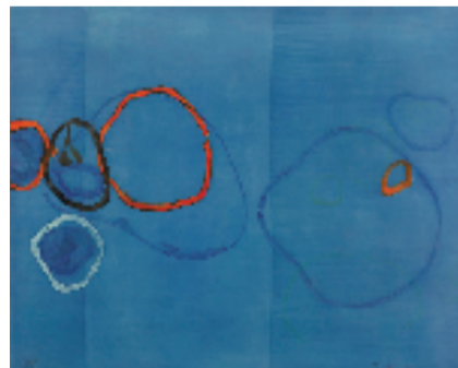
谭平 忧郁 80x100cm