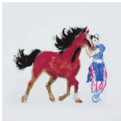
冯梦波 人马情深 56x76cm