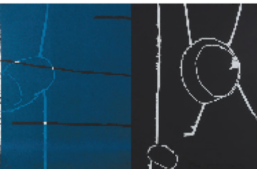
谭平 无题(2020MB-046) 80x120cm