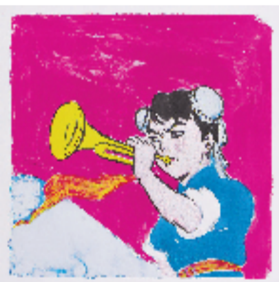
冯梦波 小小号手 56x76cm