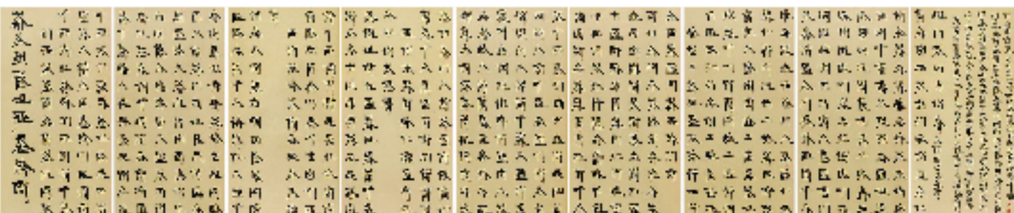
徐冰 英文方块字书法:兰亭集序 99x189cmx9