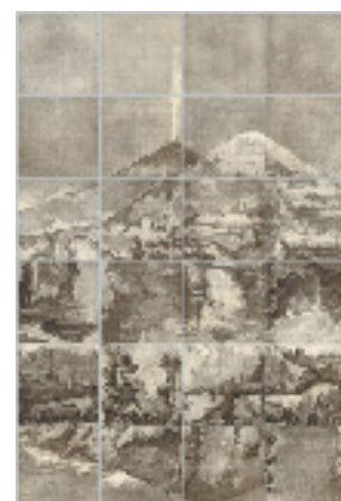
苏新平 荒原3号 300x200cm