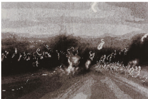
陈琦 寓言 80x120cm