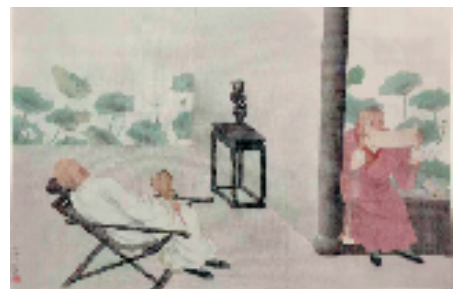
余启平 风如斯 41x65cm

近年来,海宁“西山雅集”系列活动的成功举办,更好地宣传和推广了海宁市名人文化,更好地挖掘、研究、宣传了钱君匋先生的艺术成就及弘扬了钱君匋先生爱祖国、爱家乡、爱民族文化的高尚情怀。本次活动也是“西山雅集”系列活动中的一个子课题,旨在以钱君匋绘画为切入点,对其人其艺展开研究探讨,希望能在中国传统绘画艺术的守正创新上得到启发,让中国传统绘画在新时期在拓展和拔高上有所进步。