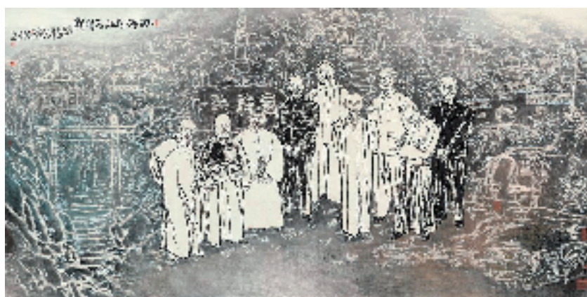
吴永良 西冷印社先贤图 124x248cm 2003年

作为浙派人物画第二代领军人物之一,中国美术学院中国画系教授、著名人物画家吴永良先生,不仅在书画创