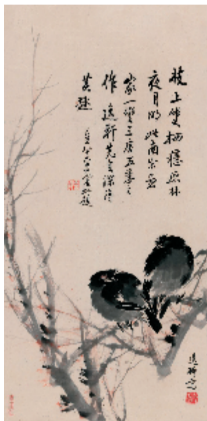
邵逸轩 疏林双栖 77.5x37.5cm 约 1949年

邵逸轩一生跨厉晚清、民国、新中国三个阶段,他是近现代中国画坛特别是京派绘画领域的重要画家,民国时期誉满京津,但由于多方面的原因,其病故后一度销声匿迹,鲜为人知。好在时间终会吹去历史的尘埃,优秀的作品终会发出光芒,近几年来,邵逸轩及其作品又慢慢重回人们的视野,中国美术馆、北京画院等专业机构,开始展出邵逸轩作品;各大拍卖会更是频频上拍邵逸轩作品,很多收藏家也开始把目光转向邵逸轩……如今正逢清明盛世,我们有必要回顾先贤,重新挖掘、整理、展示他的人生事迹和艺术成就,吹尽狂沙始到金,相信邵逸轩的艺术会让世人有更更新更深的认识。认识乡贤,了解东阳之文脉;走进乡贤,谨表我辈之敬重;推广乡贤,弘扬乡土之文化;学习乡贤,激励后生之发奋,此乃展览之意义。