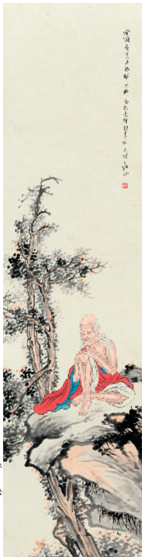
邵逸轩 红衣罗汉图