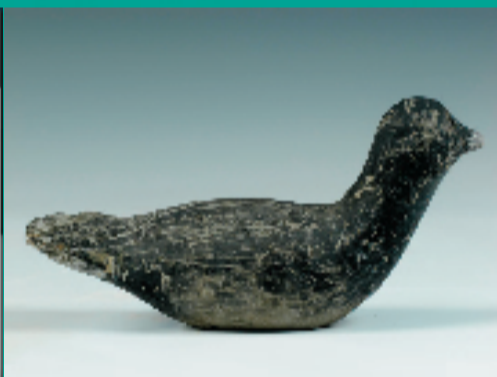
新石器时代良渚文化黑陶鸟