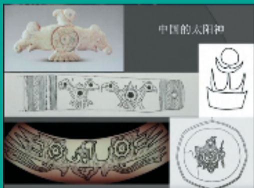
各种文化时期的鸟纹

在良渚文化骨器、陶器中，鸟的形象频频出现，有鸟形立体圆雕，也有雕刻在器物上的鸟纹；还出土了细刻鸟头蛇身和鸟纹的黑皮陶豆、刻有鸟纹的陶刀、双头鸟首陶壶、鸟形盖等，证明了良渚人对鸟的图腾崇拜。良渚文化出土一件黑陶鸟（见黑陶鸟图），鸟呈卧状，尖喙，长颈，昂首，躯体丰满尾成扇形，实心，周身无纹饰，腹底有一个2.5CM深的洞。黑皮陶，胎体灰色，胎体坚硬。该器采用捏塑手法，率意洗练，形象生动。